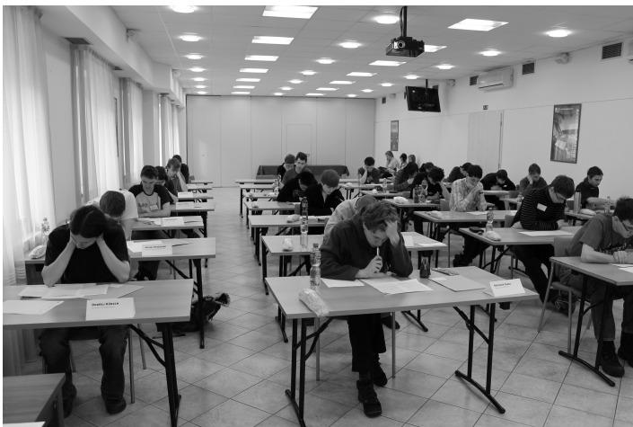
Obr. 1. Soutěžní dopoledne

Obdobně probíhala i soutěž v kategorii P. V odpoledních hodinách téhož dne se účastníci klání sjížděli, prezentovali se v Business Hotel Jihlava a ve večerních hodinách besedovali. Ve čtvrtek dopoledne řešili teoretické úlohy, opět v hotelových prostorách. Odpoledne se i oni seznamovali s jihlavskými pamětihodnostmi. V pátek 22. 3. plnili soutěžící úkoly druhé části soutěže v počítačové učebně Gymnázia Jihlava, v jehož zasedacích prostorách byly odpoledne vyhlášeny i výsledky.