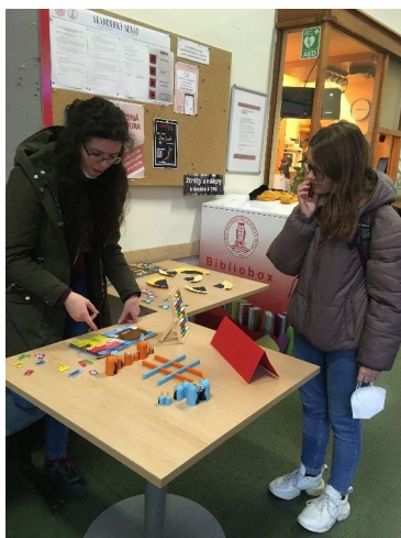
Obr. 1: Stánek s aktivitami pro MŠ

V pondělí 14. 3. 2022 jsme na Pedagogické fakultě oslavili Mezinárodní den matematiky . Organizace se ujala Katedra matematiky a didaktiky matematiky. Nikdo z těch, kdo vstoupili do budovy, nemohl minout naše stanoviště. Přízemí bylo věnováno matematickým hrám a problémům, které spadají do předmatematické gramotnosti v mateřské škole, první patro bylo zaměřeno na aktivity a problémy vhodné pro žáky 1. stupně ZŠ, druhé patro na aktivity pro žáky 2. stupně ZŠ. O jednotlivá stanoviště se starali studenti příslušných oborů, lákali a vyzývali k interakci kolemjdoucí studenty různých oborů, vyučující všech kateder i administrativní zaměstnance fakulty. Kdo se zapojil, dostal časopis ABC, který obsahuje i matematické problémy. Třetí patro nabízelo setkání s matematickými soutěžemi jako Pangea, Matematický klokan či Matematická olympiáda, a to v podobě materiálů k rozebrání, prezentací úloh či článků na nástěnkách, rozhovorů s těmi, kteří