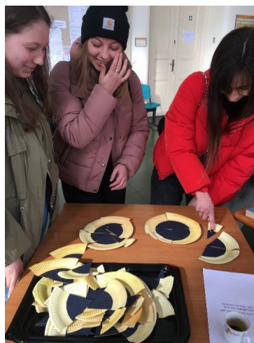
Obr. 2: Koláčové úlohy