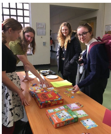
Obr. 3: Aktivity pro 1. a 2. stupeň

Na příští rok plánujeme oslavu, do které zapojíme i základní školy z okolí fakulty. Již se těšíme.