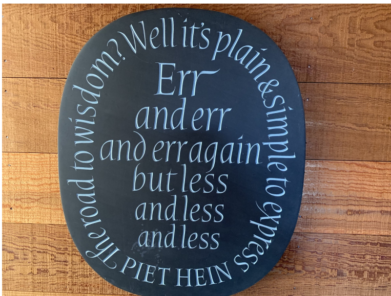
Obrázek 5: Motto u vstupních dveří do domu DEK