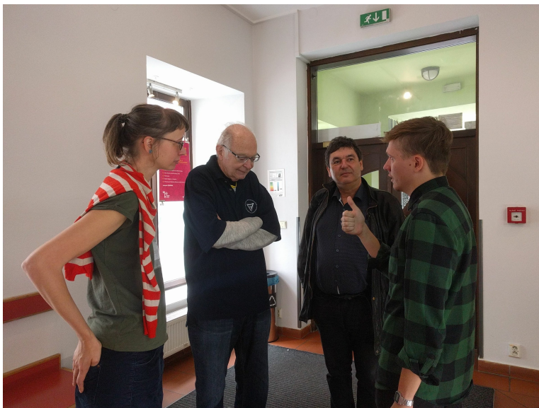
Obrázek 6: Na exkurzi v Muzeu romské kultury v Brně