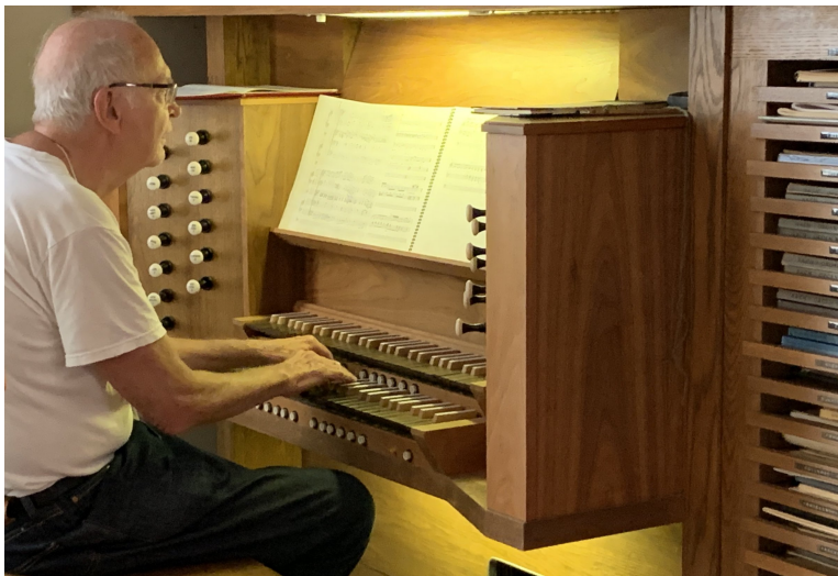
Obrázek 1: Donald Ervin Knuth hraje na své domácí varhany

při jejich nalezení, začínání dne těmi nepříjemnými, ale nutnými úkoly, hledání maximální diverzity při výběru svých činností 2 , získání maximální koncentrace a výkonu minimalismem přepínání činností a prací v dávkách, minimalizací komunikace (emailů), a při tom všem obrovské soustředění a laskavost na okolí, se kterým komunikuje kontaktně. Doufám, že si svou inspiraci hodnou následování v transkriptech najdete také! Obrázek o atmosféře přednášek si můžete udělat z přiložené fotoreportáže; fotky z 8. a 9. 10. jsou dílem Martiny Morávkové, ostatní jsem fotil sám.