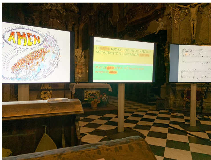
Obrázek 19: 11. 10. 2019 Závěr Fantasia Apocalyptiky: AMEN!