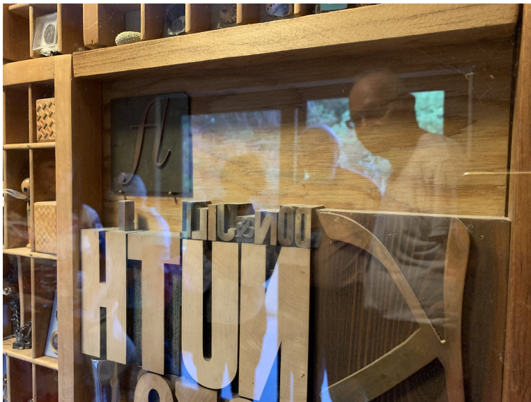
Obrázek 2: U DEK v Palo Alto při TUG 2020