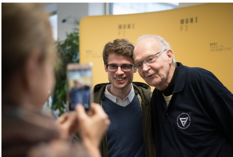
Obrázek 9: Focení s návštěvníky přednášky 8. 10. 2019 na FI MU