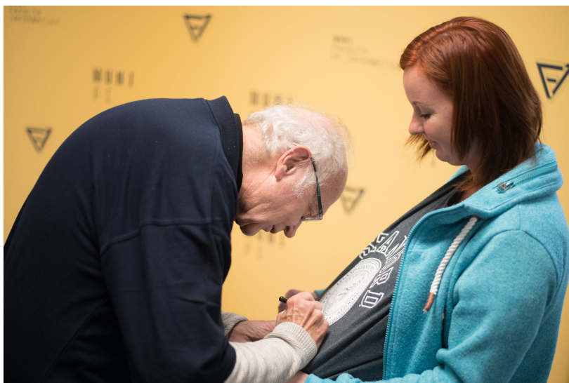
Obrázek 8: Podepisování po přednášce 8. 10. 2019 na FI MU