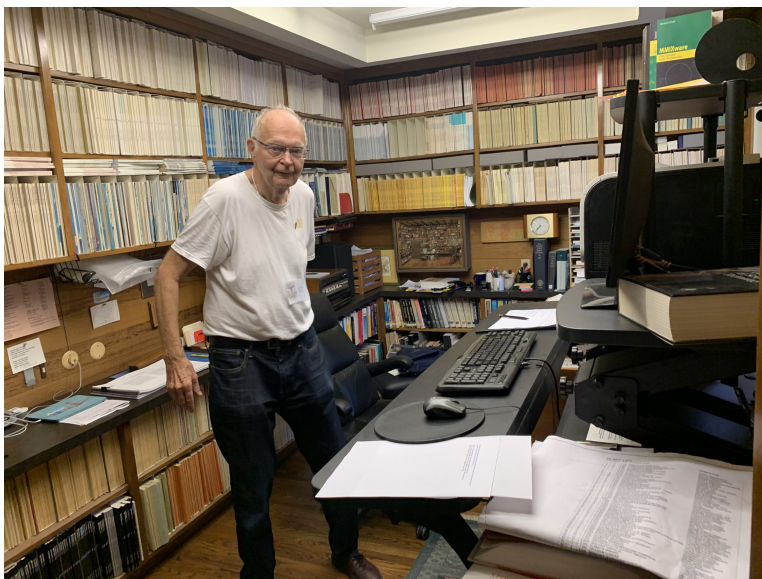
Obrázek 3: DEK ve své hlavní pracovně