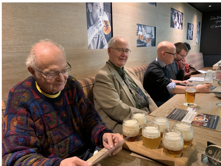
Obrázek 15: S dalším držitelem Turingovy ceny Dana Scottem po jejich přednáškách 9. 10. 2019 v Brně