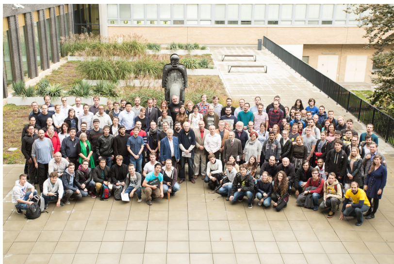
Obrázek 10: Focení s návštěvníky přednášky a akademiky FI MU 8. 10. 2019