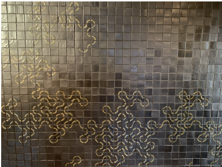
Obrázek 4: Dračí křivka (s chybičkou) ve vstupní hale DEK