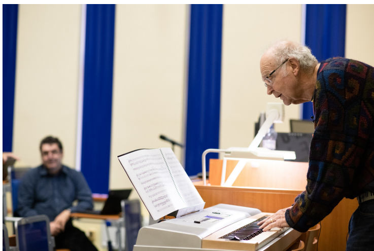
Obrázek 13: Knuthova přednáška 9. 10. 2019 na FI MU: ukázky z Fantasie