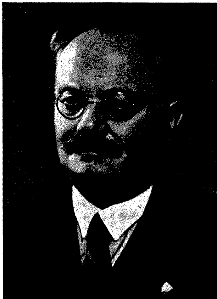
FRANTIŠEK ZÁVIŠKA * 18. XI. 1879, † 17. IV. 1945